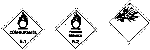
Etiqueta de riesgo secundario (igual que la de explosivos pero sin letras ni número).

5.1 Sustancias oxidantes: Símbolo una llama sobre un círculo. Colores: Fondo amarillo; símbolo, letras y números en negro. 5.2 Peróxidos orgánicos: Símbolo una llama sobre un círculo. Colores: Fondo amarillo; símbolo, letras y números en negro.